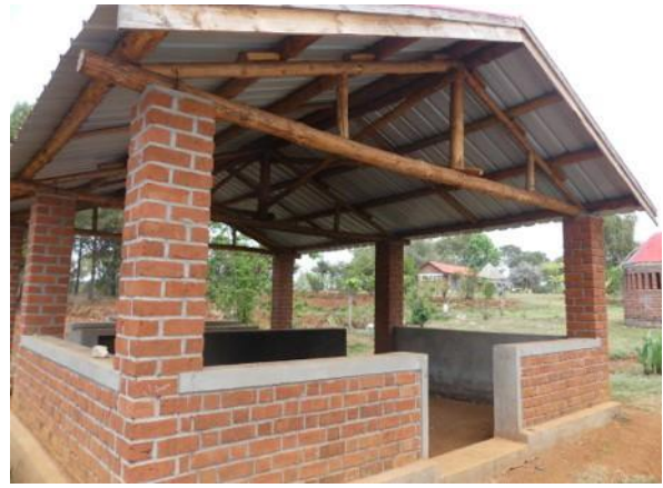
Overkapping voor de kookplaats