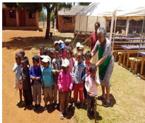
De kleuterklas krijgt als eerste opgediend