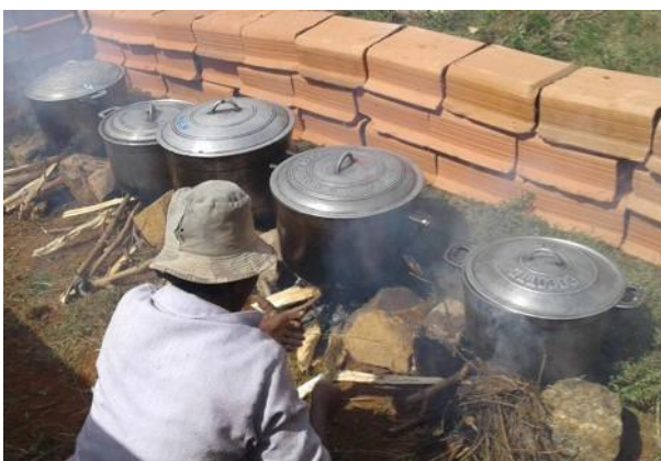
Bereiding van de dagelijkse maaltijd

Een overzicht van de totale kosten van de maaltijden is gegeven in Tabel Kantine-2, gebaseerd op een analyse van de dagelijkse inkoop van ingrediënten, gespecificeerd in de maandaftrekkingen.