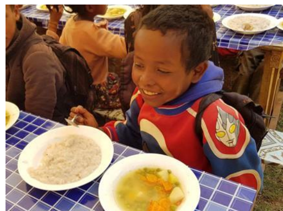
Bord met rijst en groenten, (aardappelen, wortel en prei)