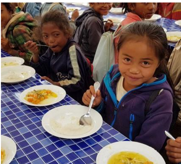
Een voedzame maaltijd van rijst en groenten

Het initiatief is doorgegaan in het schooljaar 2018-2019 en na het laatste bezoek van Mart en Ine in november 2019 is iedereen enthousiast begonnen met het schooljaar 2019-2020.