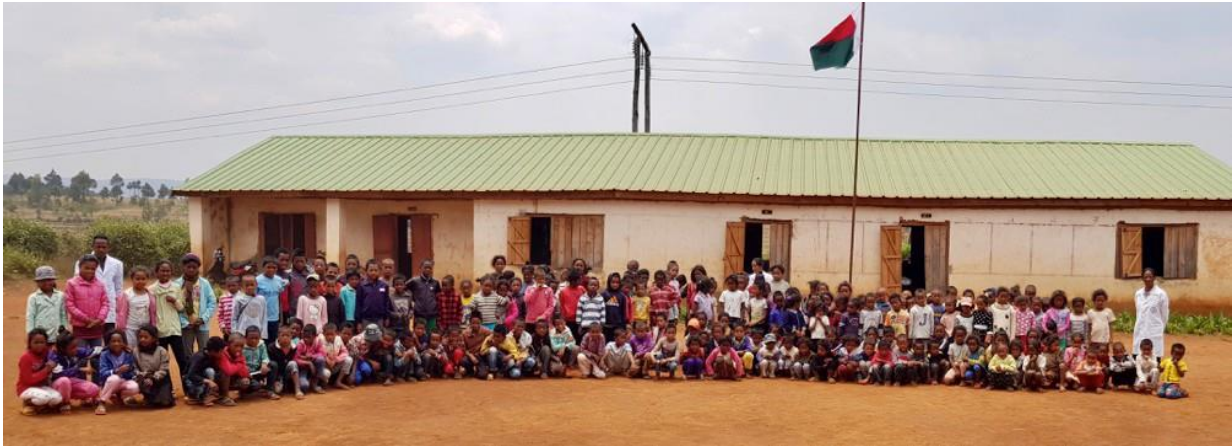
School foto EPP Fiadanana 28 oktober 2019